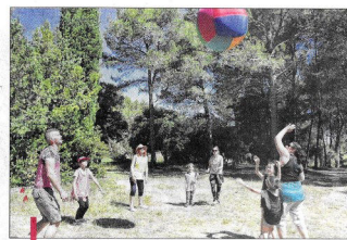
Le kin-ball, un sport collectif qui vient du Québec et où l'on joue avec une balle d'1,22 m de diamètre.

Et c'est ainsi que parents et enfants des écoles Péri, de Cabannes, des Paluds-de-Noves et de Verquères ont participé à