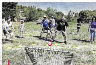
Sept ateliers étaient proposés aux enfants et à leurs parents et les équipes étaient mixtes pour toutes les rencontres.